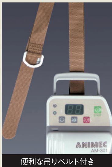
便利な吊りベルト付き